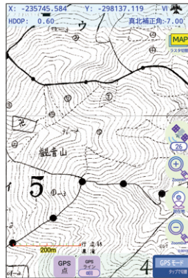
背景に計画図を表示