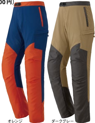
オレンジ ダークグレー

登山用ウェアで培われた素材や機能を元に作られた、薄手の林業作業用パンツです。重量 360g。 ※チェンソー用防護性能は備えていません。 (10,500円)