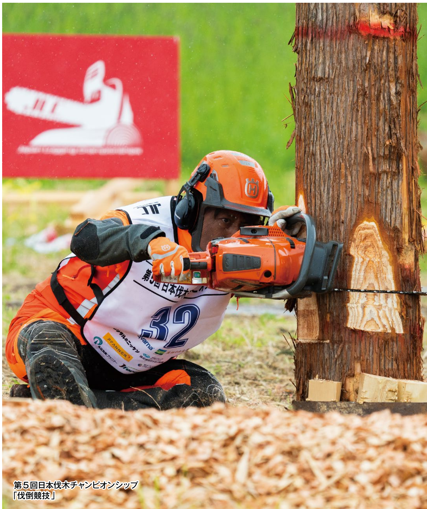
第5回日本伐木チャンピオンシップ 「伐倒競技」