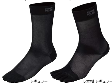
レギュラー 5本指 レギュラー